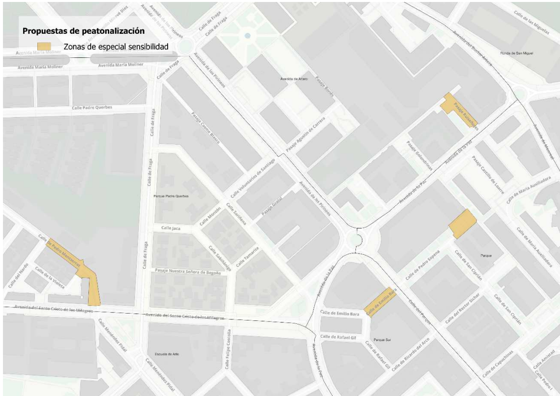
Ámbito 3. Zonas de Especial Sensibilidad

Relación de calles incluidas en la Zona Peatonal de la ZBE (ámbito 1)